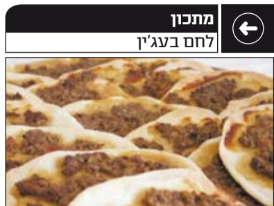
המצרכים (ל-25 יחידות)

לבצק: 2 כוסות קמח רגיל, כפית מלח, 2 כפות שמן, חצי כוס מים פושרים למלית: חצי קילו בשר טחון טרי מתובל במלח, פלפל ובהרט, בצל גדול מגורר בפומפיייה, עגבניות מבושלות ומקולפות, חצי כוס רוטב עו או סירופ רימונים, כף רסק עגבניות, מלח, פלפל, שתי כפות סוכר